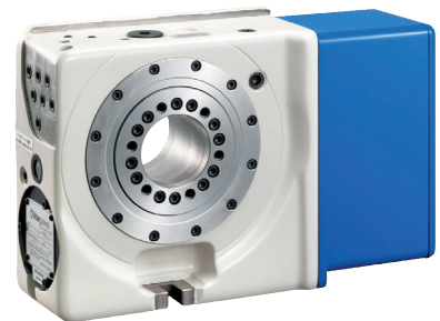
Kitagawa CK160 Rundmatningsbord

Tippbar modell med dubbla spindlar Lämplig för 4- eller 5-axlad bearbetning.